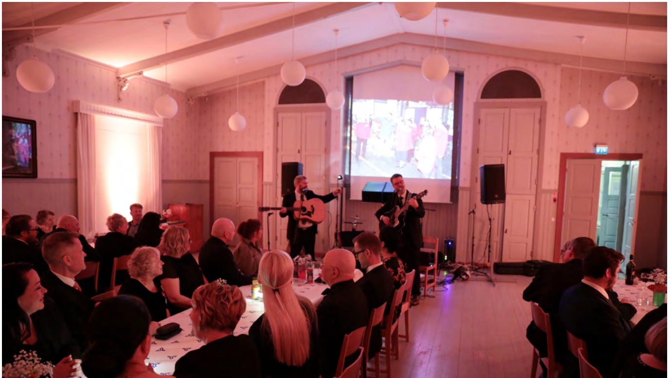
Yhdistyksen vuosijuhlia vietettiin 15.11.2025.