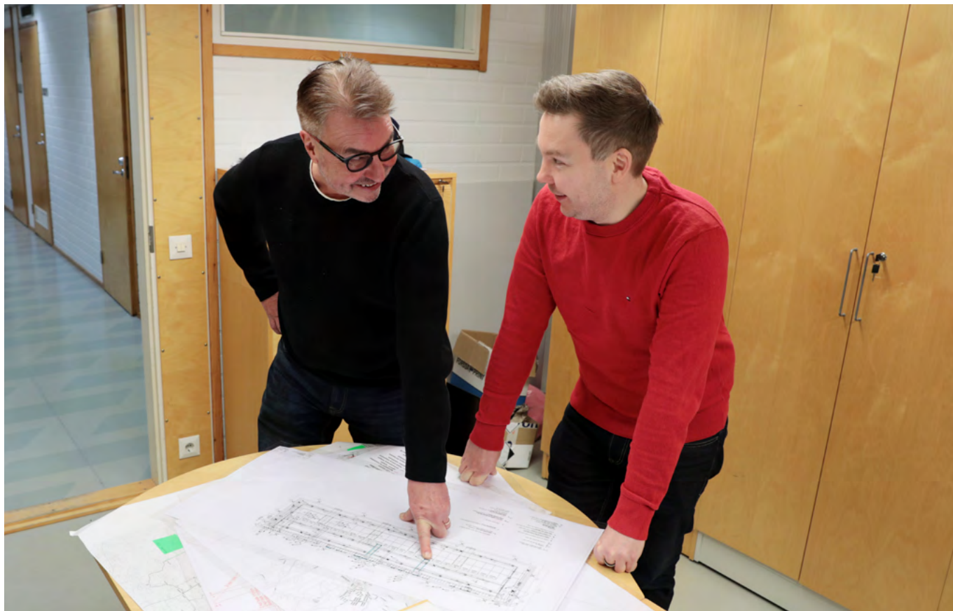
Kaverusten yhteistyö on toiminut hyvin ennen Jyrkin siirtymistä eläkkeelle.