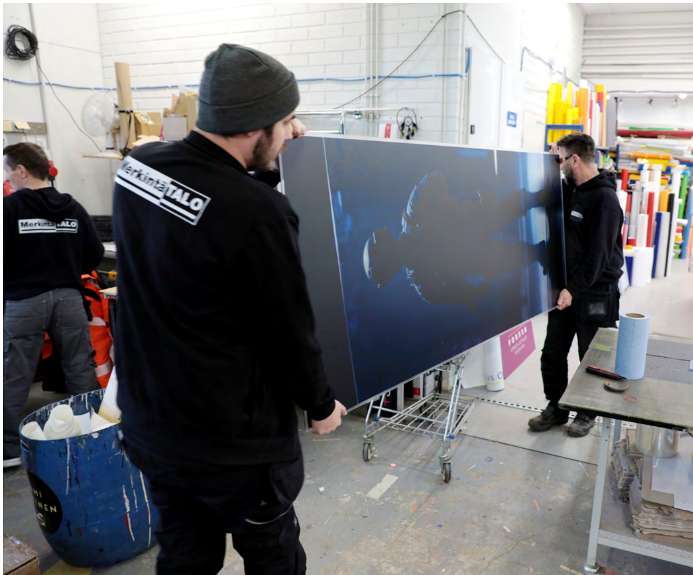
Lasille tehty tasotulostus lähdössä asiakkaalle.