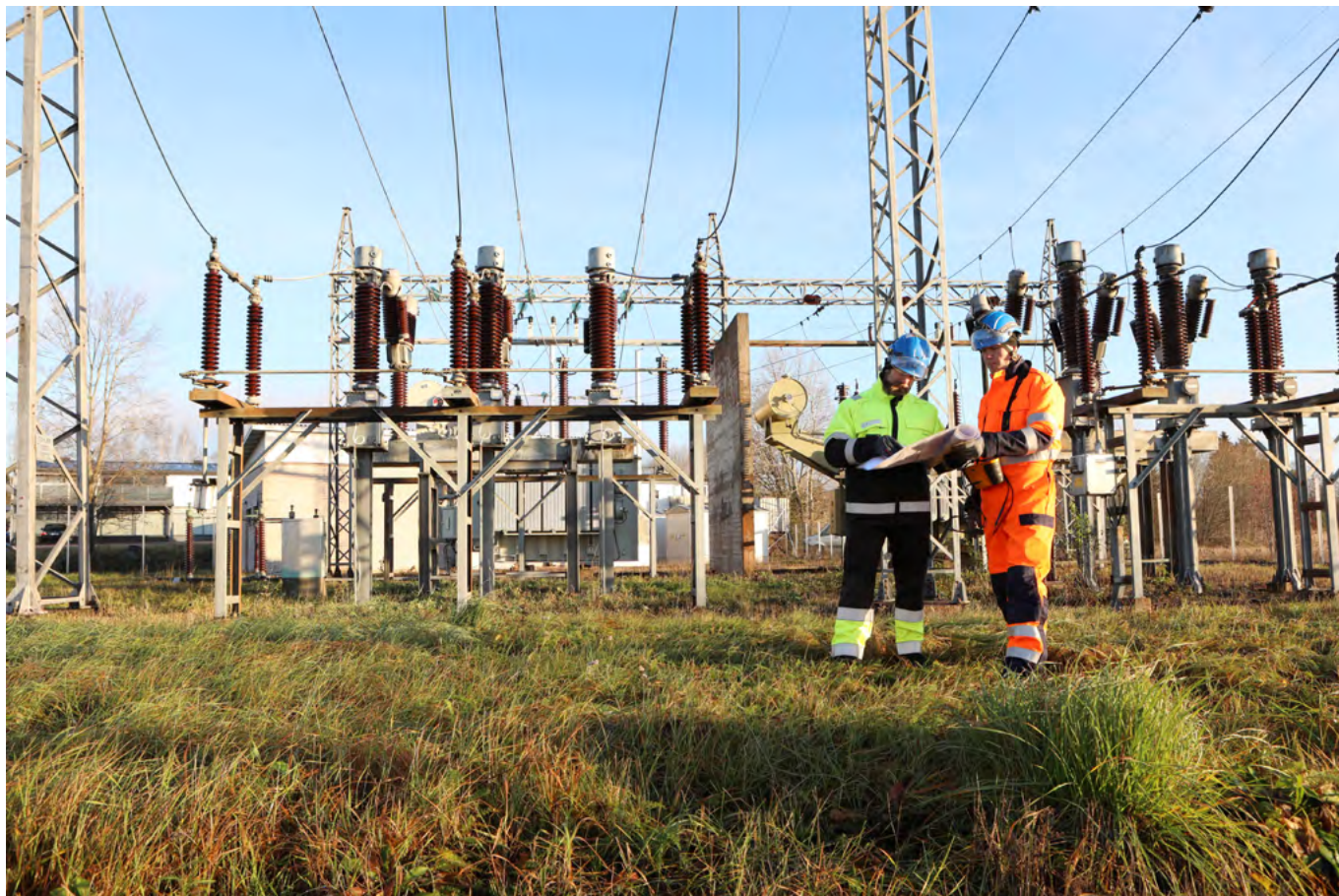
Sähköverkon parannustyöt sekä kytkinasemien huolto- ja päivitystyöt ovat verkkoyhtiölle arkipäivää.

tehty esimerkiksi latatuspisteiden asennuksia, kertoo Jiri.