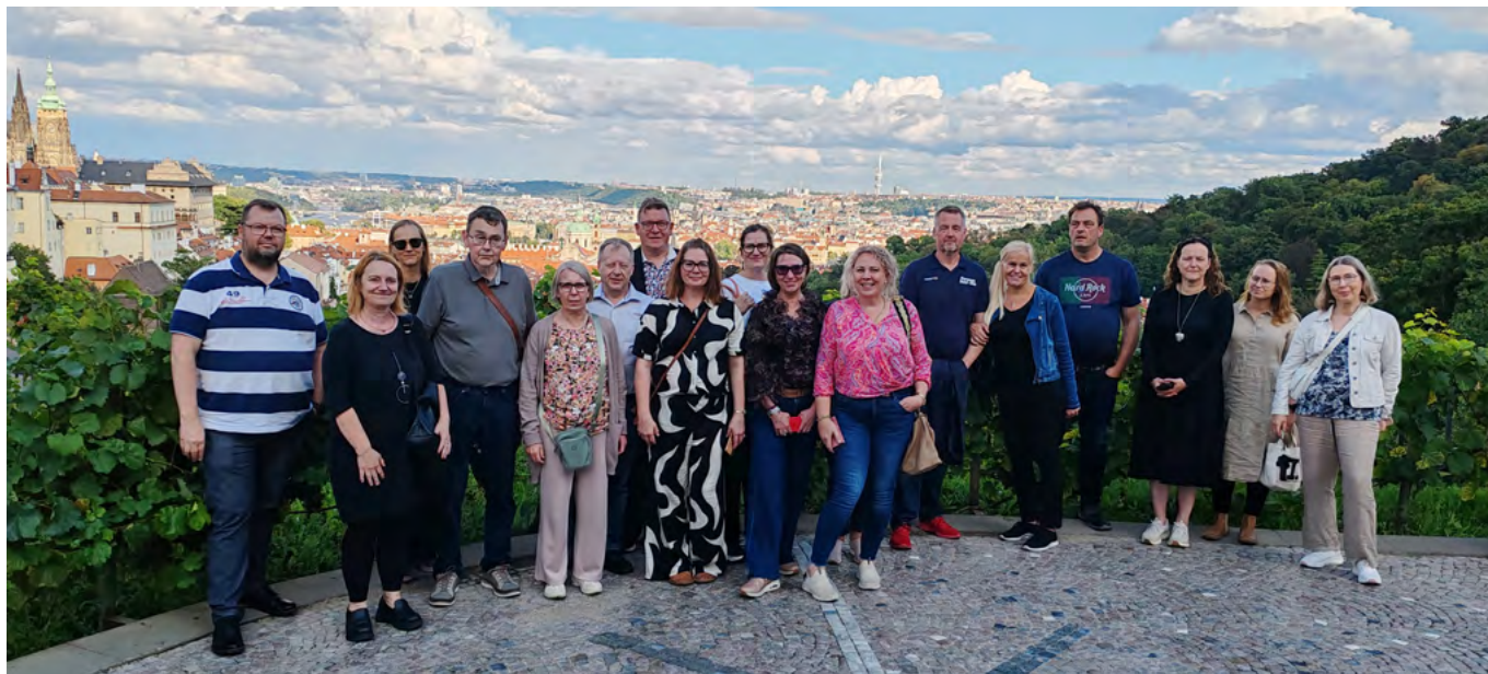
Praha on kukkuloiden ympäröimä, näköalapaikalla kätevälaisten joukkoa.